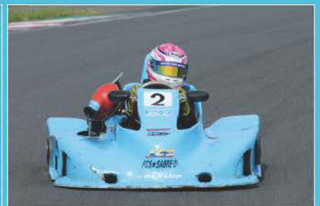
好調な予選から一変、決勝はブレーキを引きずるトラブル発生ながらも2位に入る保立