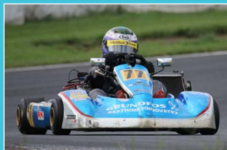
展開にも恵まれたと言う上杉が激しい混戦となったSK2を制する