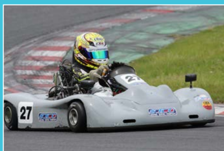
YUUKAの走りは第3戦も衰え知らず。ポールtoウィンで三連勝目をゲット!