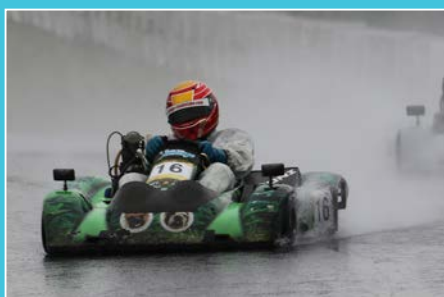
「予選のトップタイムが全ての勝因です」 SK1でポールtoウィンを決めたゼンタ