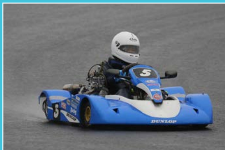
今シーズンよりスーパーカートに初参戦の室だがキャリア不足を感じさせない走りでの勝利