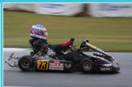
混戦模様のSK2では藤木がスルスルと集団を抜け出し前戦に続いて優勝を勝ち取る