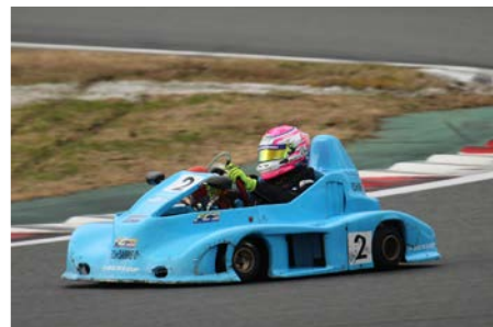
最終戦を勝利で飾るもあと一步、頂点には届かなかった保立。来年に気持ちを切り替える