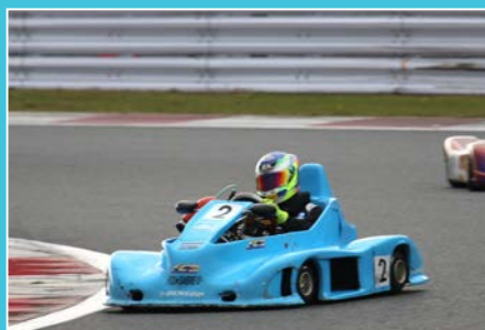
前回の筑波大会では悔しさを滲ませたSK1保立だが、今回は会心の勝利を手にした