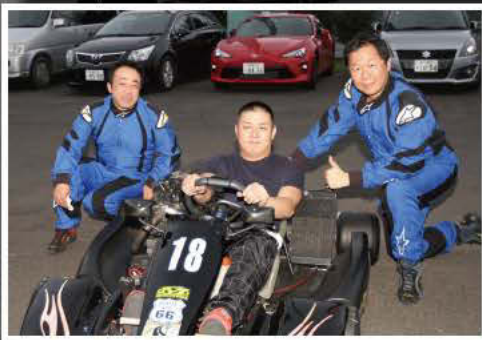
総合トップを飾った「ウォーズマンレーシング」。大きなガッツポーズと共にフィニッシュ