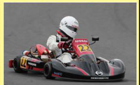
ENJOY 優勝の日産横浜自動車大学校