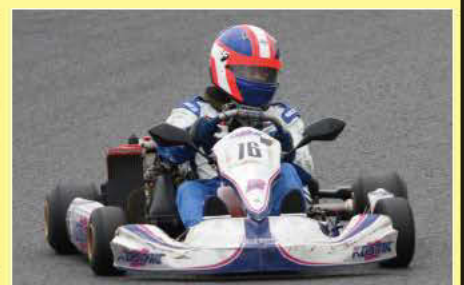
H-OPEN 優勝 TR+ブナン+水曜レーシング!