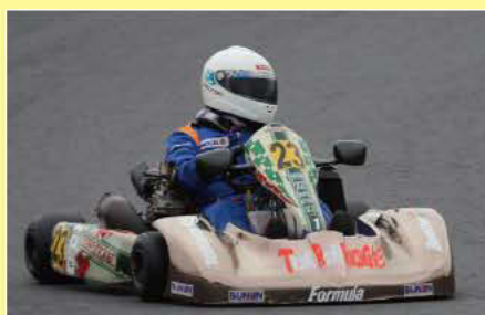
YZ125クラス優勝のTR☆れ〜しんぐ!+ぶなん

次回はよいよシリーズ最終戦。年の瀬迫る12月22日、富士スピードウェイ・カートコースでの開催となる。