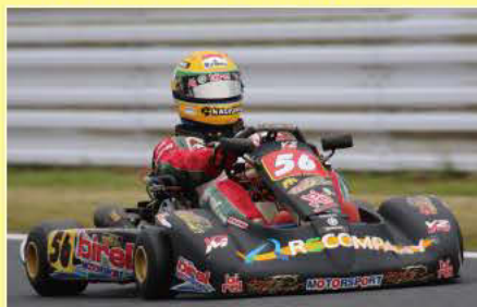
YZ250クラス優勝 TR☆ぎ Racing!+BUNAN