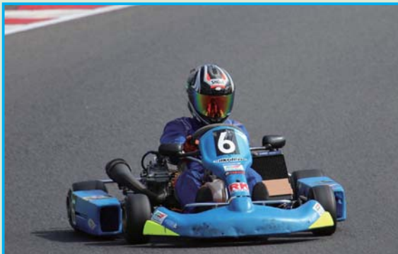
▲YZ125 クラス優勝の First Thecnica は総合でも2位に入る力走と共に33周を無事に走りきった

全クラスともに60分を無事に走りきった結果、総合トップに輝いたのは ADVAN★てるてるレーシング。「SUGO は毎年、楽しみにしているコースです。今回は冷却水が漏れてきて、後半はあまりペースを上げられませんでした。けど WR250 は SUGO くらい大きなコースになってくると凄く気持ち良く走れます」と、1年振りの SUGO を心ゆくまで満喫したようだ。