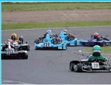
広大な SUGO が狭く感じるほどの接戦が展開した