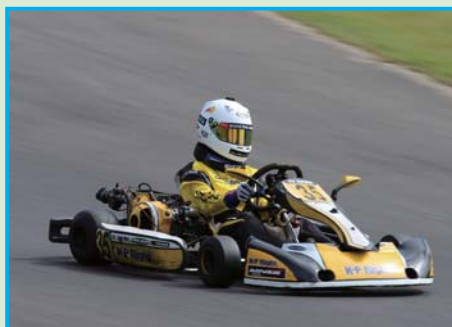
▲エンジョイクラスは GX270 を搭載するスポーツカートを使用したスクーデリア PCR K3 が参戦