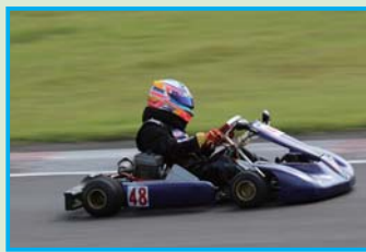
▲H-KT100 クラスは Y'zRacingClub がトップを獲得