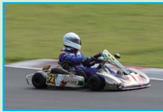
▲YZ85 クラスで2位に入賞したのは TR ☆れ〜しんぐ!+ ぶなん