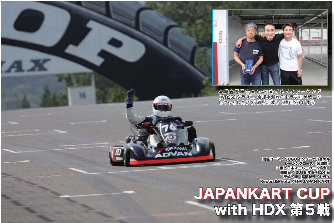
△総合優勝の ADVAN★てるてるレーシング (WR250 クラス)。冷却水漏れのトラブルが起こりヒヤッとしたが35周を走破して勝利を手にする

開催コース / SUGO インターナショナル レーシングコース (宮城県) 主催 / 日本スーパーカート協会 開催日 / 2018年9月24日 天候 / 晴 路面状況 / ドライ Report&Photo / 月刊 JAPAN KART