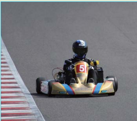
▲YZ85 クラスは常連チームでもある高根沢オートクラブ★OB チームが勝利。総合では3位に