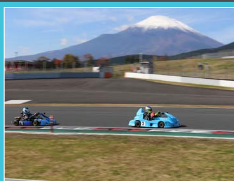
SK1 保立とSK4 桜井による新チャンピオン同士の対決