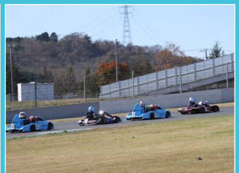
スリップに備え、キレいに隊列が揃ったトップ集団