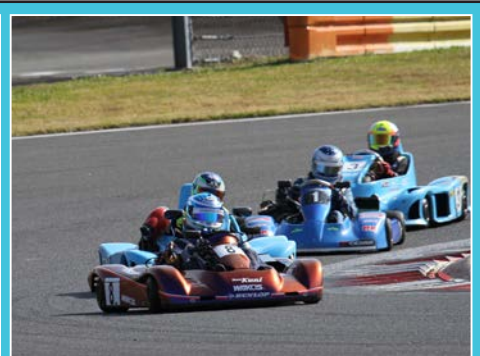
終始、接戦状態となったトップ争いを制した⑧ fumifumi